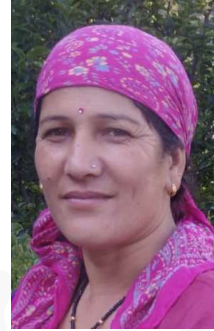
श्रीमति रिक्ेश्वरी सदस्य